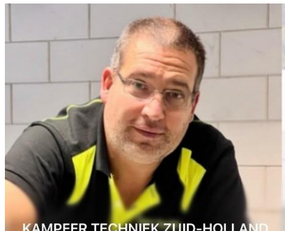
KAMPEER TECHNIEK ZUID-HOLLAND