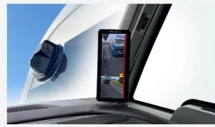
Digitale Buitenspiegels voor campers van 3DM-Vision